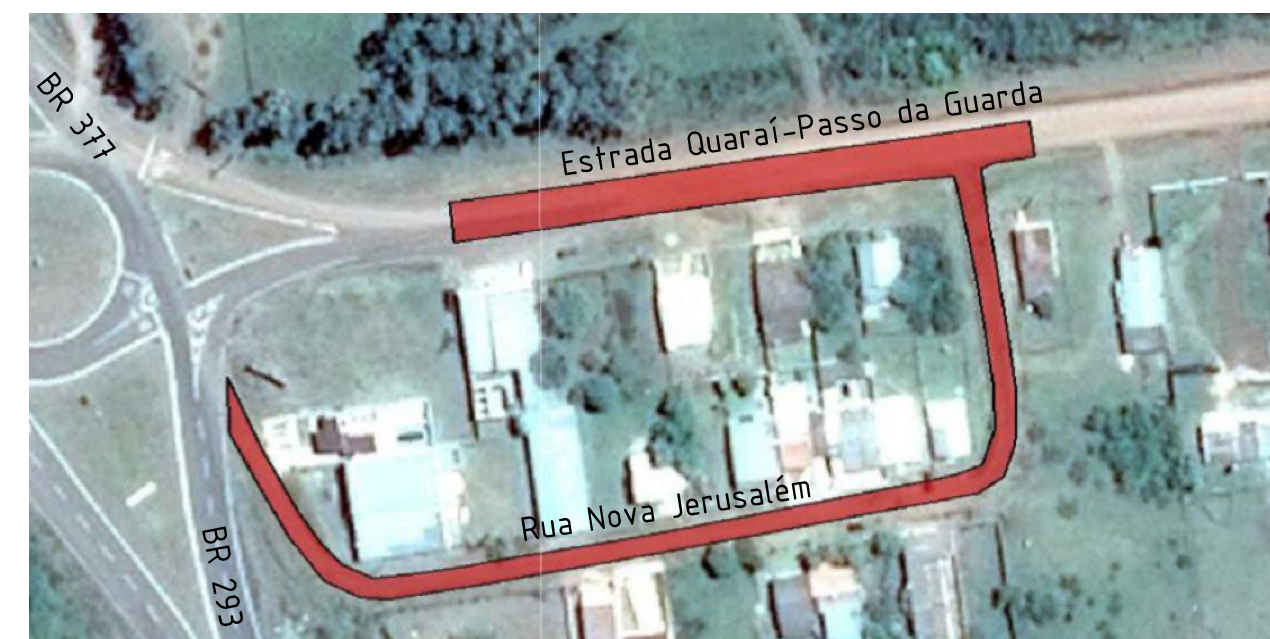
2 PLANTA DE SITUAÇÃO DAS VIAS URBANAS SEM ESCALA